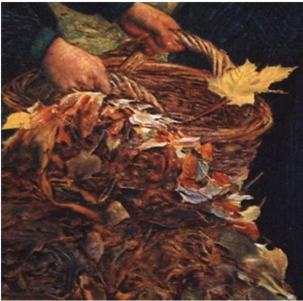
John Everett Millais (1856) Detail von "Autumn Leaves"